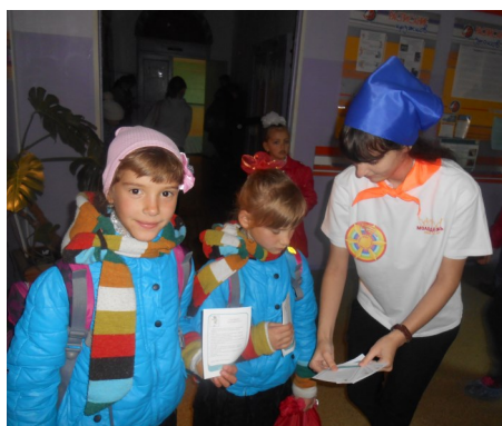
Раздаем буклеты и листовки

17 октября 2015 года председателем женской пала-