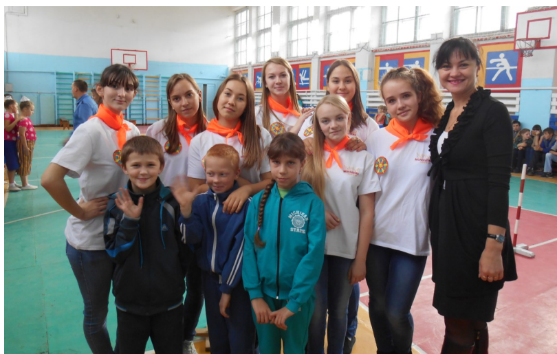
Команда лицея с волонтерами