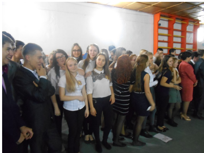
Днем торжественная линейка